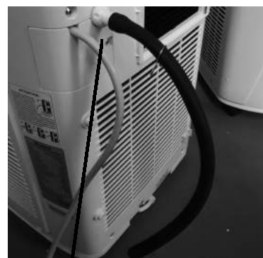
Tuyau de condensat